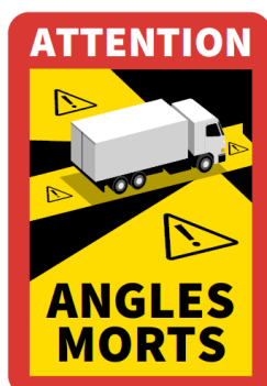
Modèle camion Réf ANGMOCAM

Format : 170 x 250 mm Adhésif : colle renforcée Encres : solid lumière Protection : film plastique transparent